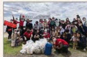
▲東京 アースデイウィーク