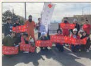
▲浜松 花のリレープロジェクト