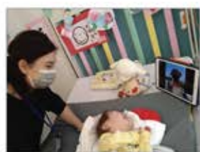
▲病院からオンラインで視聴

コロナ禍で病院でのイベントの中止、院内の遊び場が制限される中、子どもたちの興味・関心を高める学びや体験の機会をつくるため、パソナグループが運営するテーマパーク「ニジゲンノモリ」内のアトラクション「ゴジラ迎撃作戦」と兵庫県内の子ども病院をオンラインで繋ぎ、病院に居ながら体験できる「オンライン遠足」を企画。ゴジラを題材にした謎解きクイズや、現地スタッフがゴジラの体内にジップラインで飛び込む映像を配信し、小さな患者さんの笑顔がたくさん生まれた「遠足」となりました。