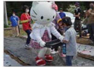
▲有機野菜の種植え

障害のある社員が無農薬・有機農法を実践する柏市の「ゆめファーム」にて、大人も子どもも環境循環を学び実践する体験型イベント。参加者は環境クイズや土づくり・種まきを体験。