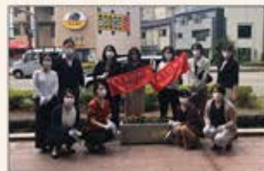
▲金沢市 かなざわ緑と花の会