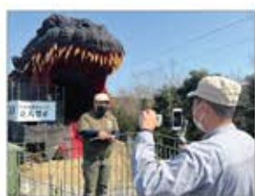
▲ゴジラ前から中継