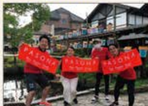
▲丸森町 齋理幻夜ボランティア