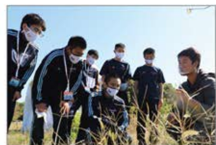
▲耕作放棄地における土づくり、種まきから収穫まで「共創・循環・多様性」の意義と食の大切さを体感