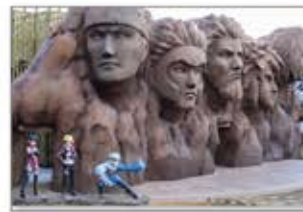
▲世界で人気の忍者アニメ「NARUTO -ナルト-」の世界観を再現した忍者アトラクション