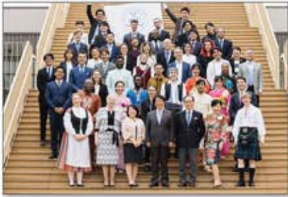
▲コロナ禍を乗り越え、2022年6月から第4期を開講