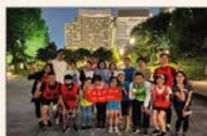
▲東京 視覚障がい者 伴走・伴歩体験会