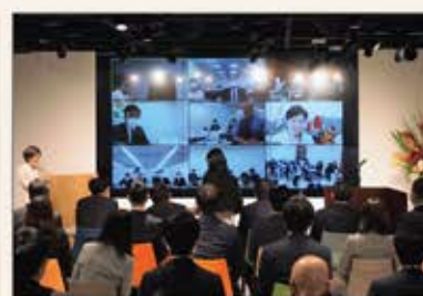
▲東京の会場と海外含む9拠点、及び在宅参加ができるよう、対面とオンラインのハイブリッド型で開催