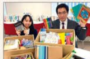
▲札幌 文具品の寄贈