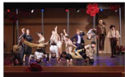
▲これまで31カ国から67組118名のアーティストが参加

淡路市・洲本市・南あわじ市等と連携し、国際交流、芸術文化の創造・発展を目的に開催。コロナ禍を受けて2021年からは国内アーティストの活躍の場として開催。