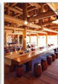
▲すぐれた断熱性はもちろん保温性、通気性を兼ね備えた茅葺屋根、再生紙による紙管の柱を建築材として利用