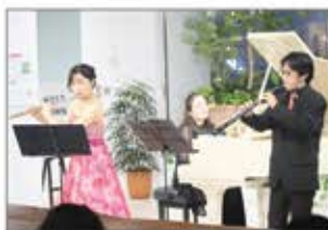
▲クリスマスコンサート

コロナ禍で活躍するエキスパートスタッフに感謝の気持ちを込めてコンサートを企画。全国で働く方や在宅勤務の方にも楽しんでいただけるようWEBでも配信。