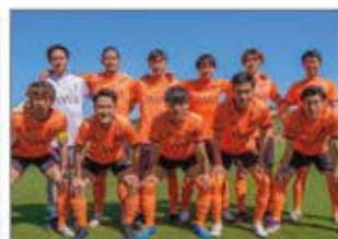
▲FC. AWJサッカーチームメンバー9名が淡路島の施設で就労