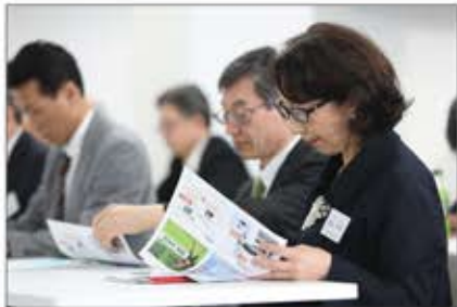
▲大学や専門機関とも提携、専門的に学習できる体制を整備