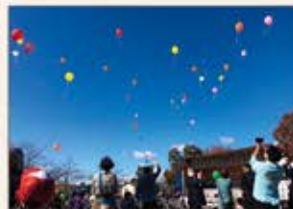
▲真備町 復興イベント運営