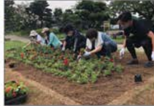
▲静岡 駿府城公園花植え