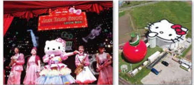
▲ギネス世界記録™にも認定された世界最大のリンゴのおうち「HELLO KITTY APPLE HOUSE」も誕生

大人から子供まで楽しめる歌・ダンス・演奏によるショーと、身体に優しい美味しいヴィーガン料理・スイーツを提供。