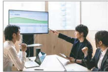
▲IT基礎からアプリケーション開発まで実践的な研修プログラム