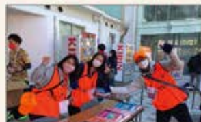
▲東京 ラグビー試合ボランティア