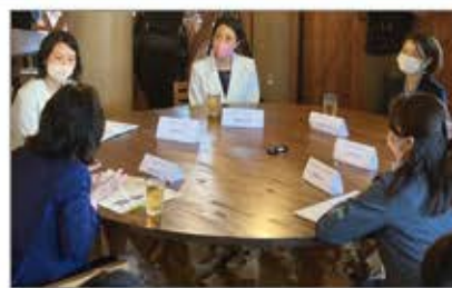
▲視察に訪れた 野田聖子 内閣府特命担当、女性活躍担当、こども政策担当、孤独・孤立対策担当大臣との意見交換会