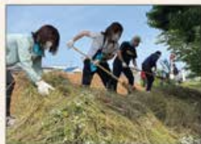
▲淡路 郡家地区草刈りボランティア