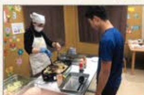
▲大阪 児童発達支援施設炊き出しボランティア