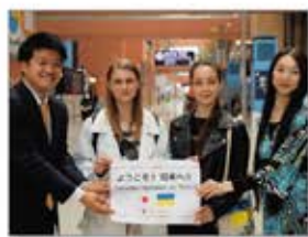
▲空港でウクライナから避難したパレエダンサーをお迎え