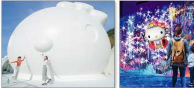
▲ハローキティの巨大オブジェは撮影スポットとして大人気

海をテーマにしたハローキティの世界をプロジェクションマッピングで体験。食の宝庫淡路島の食材で本格的な中華料理も楽しめる。