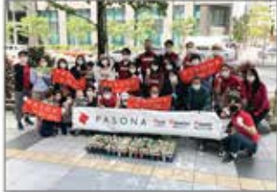
▲東京 東京ふれあいロードプログラム

花や緑でつまれた美しい街の実現に向けて、公道沿いの花壇で草花の植付けや清掃活動を実施。