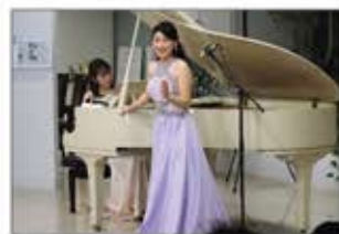
▲国際女性デー ナイトコンサート