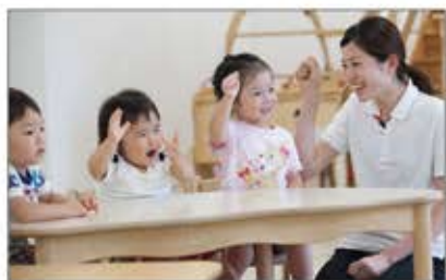
▲社員・エキスパートスタッフが子育てしながら働ける企業内保育所「パソナファミリー保育園」