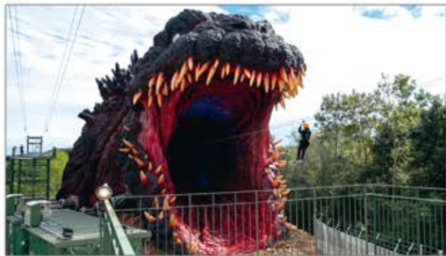
▲淡路島に上陸した世界最大 実物大のゴジラをテーマに、強大さと迫力を体感できるアトラクション。世界初常設ゴジラミュージアムも併設