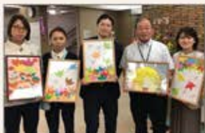
▲愛知/静岡 介護施設へ季節の折り紙作品寄贈