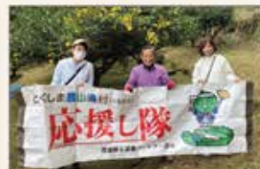
▲徳島県 ゆず収穫ボランティア