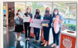
▲タイ 貧困エリアの子どもたちへ