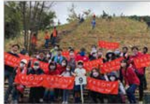
▲東京 高尾小仏植樹祭