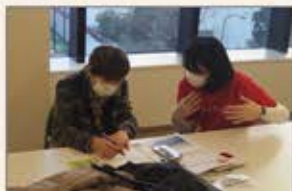
▲東京 高齢者向け スマホ教室