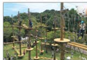
▲大人も子供も楽しめるジップラインや巨大アスレチック