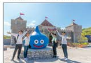
▲「ドラゴンクエスト」の世界を再現したフィールドRPGアトラクション