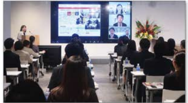
▲国内・海外をつなぎ社会貢献活動報告会を年2回開催