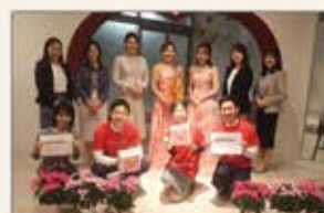
▲東京 ピンクリボンチャリティコンサート