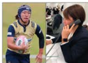
▲競技とオフィスワークのハイブリッドキャリアを実現