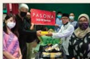
▲インドネシア ランチボックス提供