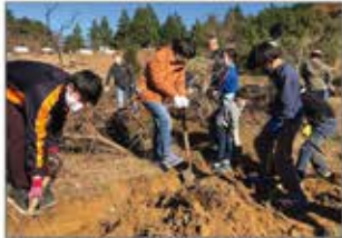
▲千葉 苗木の森プロジェクト

生物多様性に富んだ安定した防災・環境保全林を形成するためのふるさとの森づくり活動に参加。周辺の草抜きや育樹活動を実施。