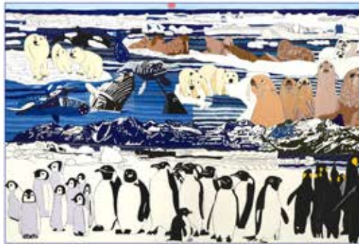
表紙の絵:「北極南極」早田 龍輝