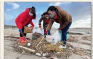
▲新潟 ビーチクリーン活動