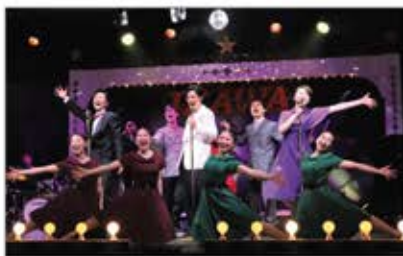
▲淡路島の各施設でコンサート、ミュージカルなど様々な活動を企画・実施

全国の音楽家が音楽活動と仕事のハイブリッドキャリアを実践し、音楽を通じた地方創生を目指す。演奏活動の機会を失った音楽家が安心して働きながら音楽活動に取り組める環境を提供。