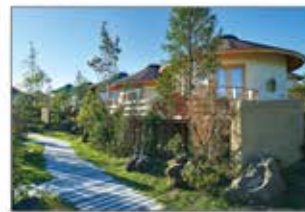
▲「ニジゲンノモリ」の最も高台に位置し、神戸の街並みを一望できるラグジュアリーヴィラ

© 白井慎人 / 双葉社・シンエイ・テレビ朝日・ADK © 白井慎人 / 双葉社・シンエイ・テレビ朝日・ADK 1993-2022 © 岸本斉史 スコット / 集英社・テレビ東京・びえろ TM & © TOHO CO., LTD. © 2021 ARMOR PROJECT/BIRD STUDIO/SQUARE ENIX All Rights Reserved. © 吾井呼世晴 / 集英社・アニプレックス・ufotable