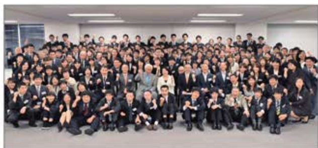
▲障害のある社員と健常者がともに働くパソナハートフル

「障害は個性、才能に障害はない!」をコンセプトに、働く意欲がありながら、就労が困難な障害者がイキイキと働ける環境と健常者と共に社会参加できる“共生”の場を創りだしてきました。特例子会社パソナハートフルをはじめ、グループ各社で個々の能力を活かして活躍の場を広げています。