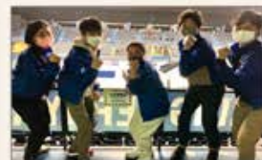
▲福岡 バスケットボールボランティア